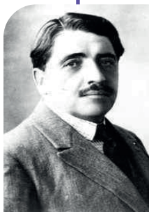
Luis Napoleón Dillon (1875-1929). Empresario, intelectual quiteño, socialista, líder de la primera Junta de Gobierno Provisional (10 de julio de 1925).