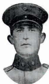
Mayor Idelfonso Mendoza Vera

Altos oficiales que contribuyeron a la Revolución Juliana