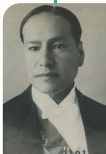
Isidro Ayora Cueva (1879-1978). Médico, profesor y político. Luego de ocupar el rectorado de la UCE, fue llamado a integrar la segunda Junta de Gobierno Provisional (1 de enero de 1926).