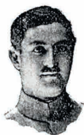
Mayor Carlos Guerrero