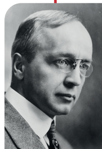
Edwin Walter Kemmerer (1875-1945). Economista y asesor de varios países, principalmente latinoamericanos. Líder de la Misión Kemmerer que llega a Quito el 16 de octubre de 1926.