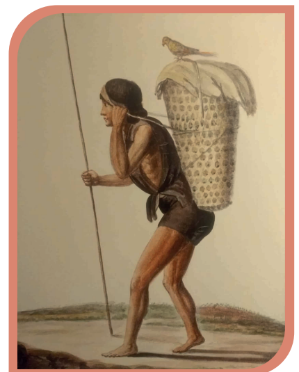
Fotografía "Chalas", Gregory Jiménez, 2021. Complejo Arqueológico Tulipe.

La cultura yumbo tuvo su mejor época de desarrollo en el período de Integración (año 500 d.C.-1.500 d.C.), posteriormente con la llegada de los Incas inició una dinámica de cambios políticos (año 1.500 d.C.) y más adelante con la conquista española atravesaron por una serie de dinámicas impuestas por el nuevo régimen (año 1534 d.C.).