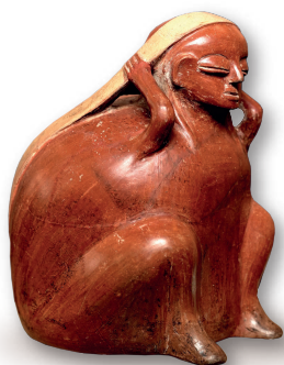
Botella antropomorfa, Cargador, Cultura Chorrera. Colección Ministerio de Cultura y Patrimonio del Ecuador

Estudios arqueológicos evidencian que existen vestigios del intercambio desde el periodo Precerámico, el transitar de las culturas de un lugar a otro generó una suerte de caminos por donde movilizaban sus productos para cambiarlos. La domesticación de la agricultura y el manejo de la cerámica permitieron afianzar y diversificar el intercambio de productos entre las regiones.