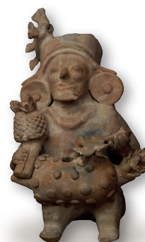
Estatuilla antropomorfa con elementos frutales y tocado con pájaros, Cultura Jama Coaque. Colección Ministerio de Cultura y Patrimonio del Ecuador

Los recorridos eran largos, circulando por rutas que conectaban las tres regiones: Costa, Sierra y Amazonía , su lugar de destino era el Qatu o tianguéz (mercado) , donde se reunían para efectuar el trueque o intercambio de productos.