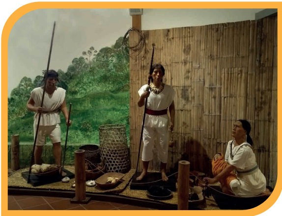
Figuras de Cera, 2007. Complejo Arqueológico Tulipe.

Una lista de productos cotizados se registran: pepas de cacao , conchas Spondylus , pieles de animales, hojas de coca , esmeraldas, tejidos de algodón, tabaco, collares de perlas, ají, metales (cobre, oro, plata en fragmentos), hachuelas de cobre, pequeñas conchas ensartadas, cuentas de concha Spondylus , plumas de diversos colores, fragmentos de obsidiana , sal de minas, piedras trabajadas para uso utilitario, cerámica, textiles, entre otros.