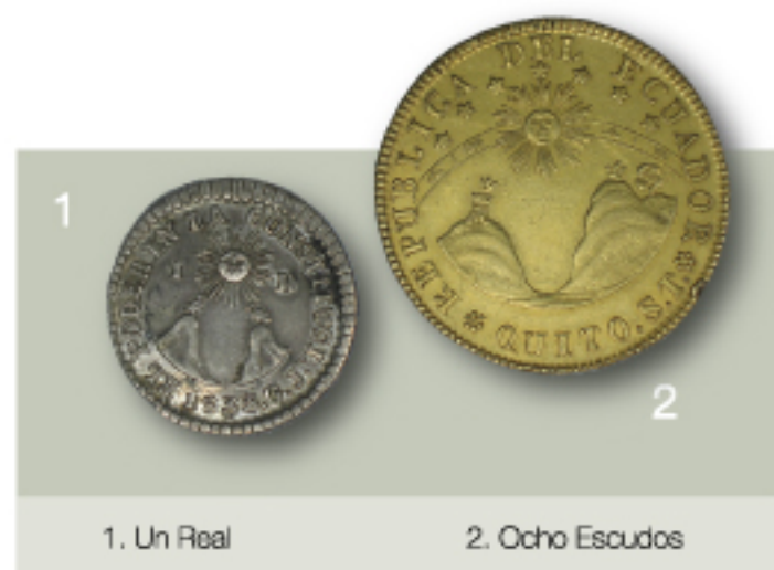
1. Un Real

En 1833 se acuñaron las primeras monedas ecuatorianas, cuyas denominaciones se basaron en el Sistema Octogesimal Español, fueron conocidas también, como Predecimales.