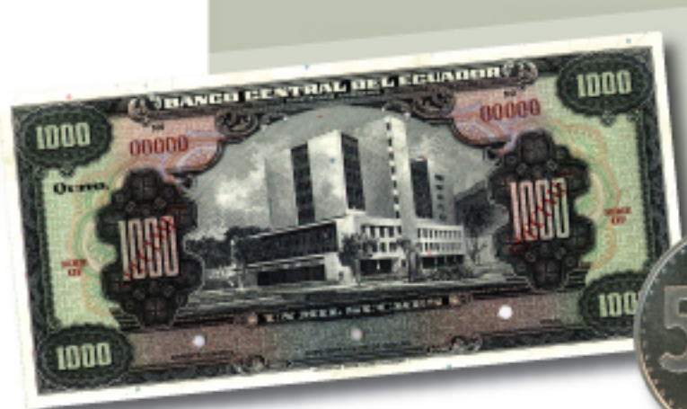
1. Mil Suces