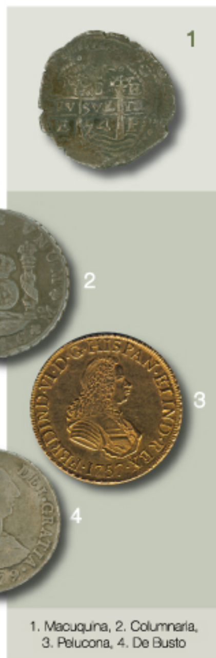
1. Macuquina, 2. Columnaria, 3. Pelucona, 4. De Busto

También se apreciarán las monedas circulares: columnarias, de busto y peluconas, son perfectamente redondas, esto fue posible gracias al empleo de la prensa de acuñación, herramienta utilizada por las cecas americanas a partir de la tercera década del S. XVIII.