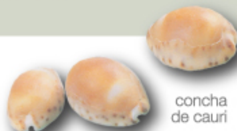
concha de cauri

El intercambio de productos o trueque entre los distintos grupos sociales, muchos siglos antes de la era cristiana, obligó a crear una forma de medida con valor tangible y manejable que facilitara esta actividad.