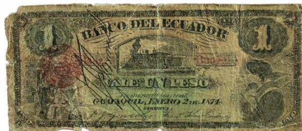
1 Peso, Banco del Ecuador, 1874, Falso. Colección Museo de la Moneda BCE

A lo largo de la historia, los falsificadores han utilizado diversas técnicas para imitar los billetes legítimos para obtener ganancias fáciles .