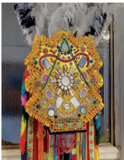
"Tocado del Corpus Christi Pujilí", 2019. Elemento Museográfico.

Con la introducción se procederá a realizarlas preguntas del VTS.