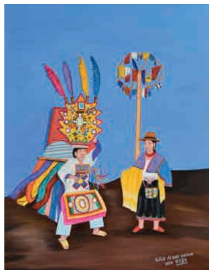
Ugsha, Cesar. 2020. Danzante pujilense. Casa de la Cultura Benjamín Carrión. https://bit.ly/3sG3eMu .

Las respuestas serán distintas por lo que se escuchará a todos y de manera inmediata se hará la reflexión sobre que es mirar y que es observar.