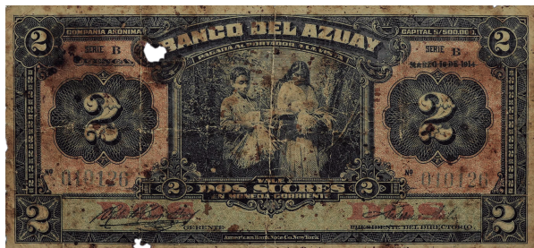
Billete: Colección Museo de la Moneda