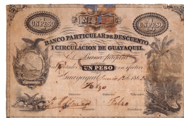
Billete: Colección Museo de la Moneda