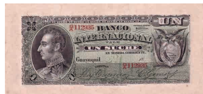
Billete: Colección Museo de la Moneda