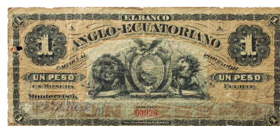
Billete: Colección Museo de la Moneda