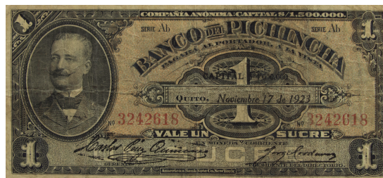
Billete: Colección Museo de la Moneda

La emisión de billetes estuvo a cargo de la casa Waterlow & Sons y American Bank Note CO.