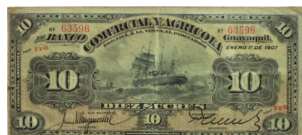
Billete: Colección Museo de la Moneda