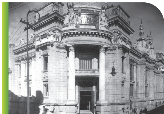
Fachada BCE, Archivo: Ministerio de Cultura y Patrimonio

Dentro de las alegorías de los billetes se puede mencionar a la diosa griega que representa la patria, el ferrocarril representando el progreso, el perfil de Antonio José de Sucre, un monumento al 10 de agosto de 1809, funcionarios del banco, imágenes de mujeres musas de las ciencias y artes, el cóndor, entre otros.