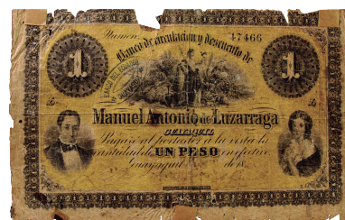
Billete: Colección Museo de la Moneda