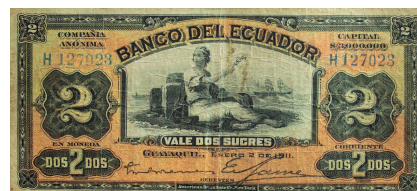
Billete: Colección Museo de la Moneda